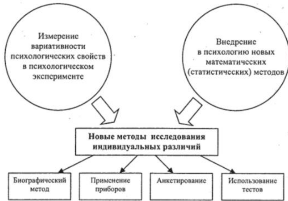
Методы дифференциальной психологии <1>

<1> Сарычев С. И. История психологии. М., 2018.