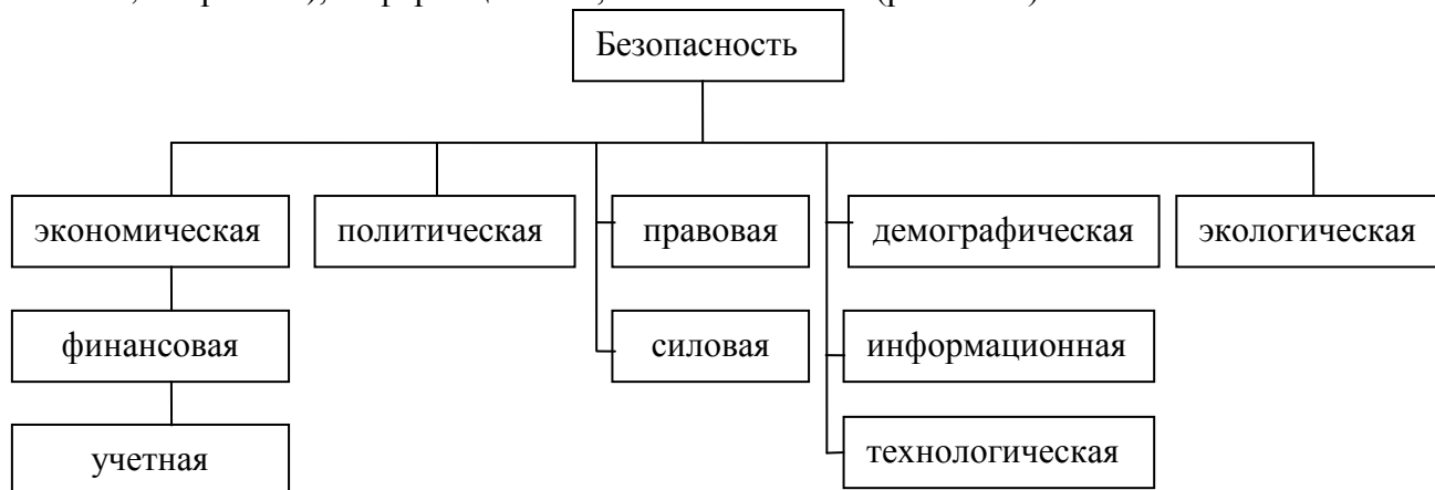
Рис. 1.1.1. Экономическая безопасность как вид безопасности

Экономическая безопасность – вид безопасности. Основными видами безопасности являются: экономическая, организационная (на макроуровне – политическая), правовая, демографическая (на микроуровне – кадровая), экологическая, силовая (на макроуровне – военная, оборонная), информационная, технологическая (рис. 1.1.1).