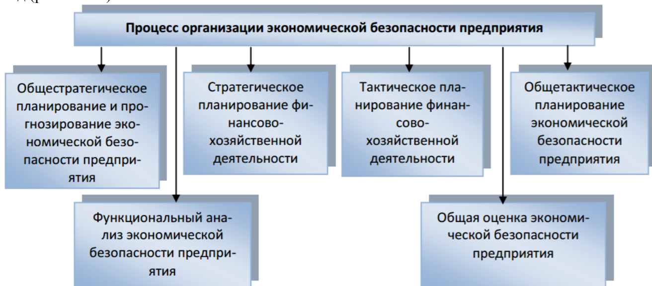
Рис. 10.1.1. Процесс организации экономической безопасности организации

Обеспечение экономической безопасности организации осуществляется на основе определенной стратегии и тактики. Общая схема процесса организации экономической безопасности организации, включающая реализацию функциональных составляющих для предотвращения возможного вреда и достижения минимального его уровня сегодня, имеет вид (рис. 10.1.1).