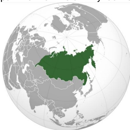
Северная Азия, она же Азиатская часть России 5

В этом нарративе Россия как управляющая компания управляет только этим участком земли: