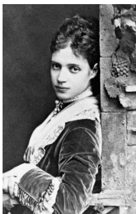
Дагмар Датская в 25 лет (примерно)