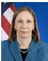
Линн Мари Трейси