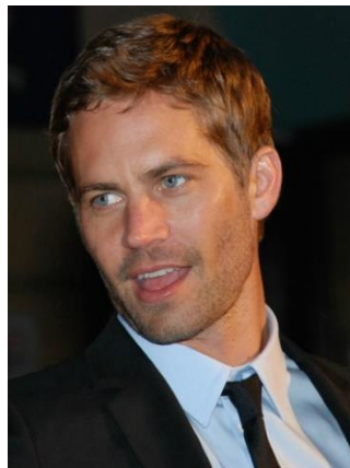
Пол Уокер 7