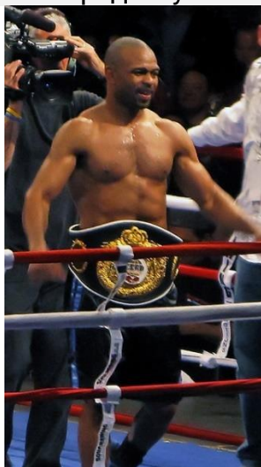
Рой Джонс 8

В качестве эталона может быть выбран чемпион мира по боксу в соответствующей весовой категории, например, Рой Джонс среди мужчин.