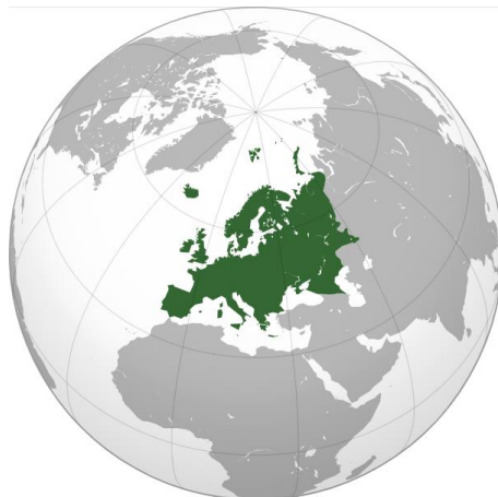
Европа (выделена зелёным цветом) 4

Как видим, в официальных нарративах через подмену объекта с тем же именем Европа реализуется концепция о единстве Европы как участка земли и Европы как другой управляющей компании.