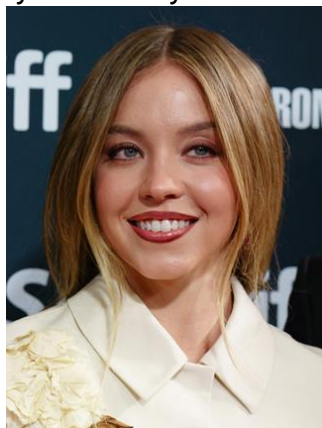
Сидни Суини 6

2. Пол Уокер - актёр со светлыми волосами и голубыми глазами, часто приводится как пример для мужчин-голубоглазых блондинов.