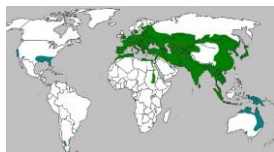
ареал дикого кабана 34