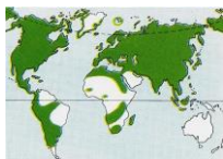
ареал белой ивы 33

По мнению Сергея Есенина, родина – это натуральная зона, мысленно образованная как область пересечения ареалов распространения ивы, свиней и жаб.